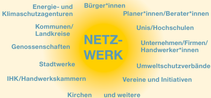
Abb.: Akteure im Photovoltaik-Netzwerk Baden-Württemberg

für Gewerbe, Privatpersonen und öffentliche Einrichtungen